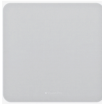
ポリッシングクロス