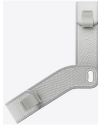
デュアルループバンド