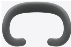
ライトシーリングクッション